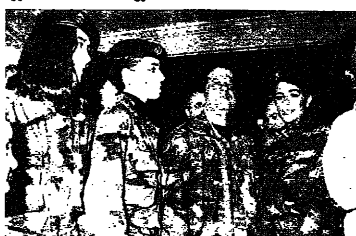
مع الجنديان في انصار الجيش